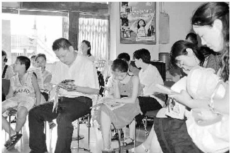
家长和孩子们在金辉旅行社咨询“阳光少年夏令营”报名事宜

由本报联合省内媒体与郑州金辉旅行社共同举办的阳光少年夏令营活动,受到家长和孩子们的热切关注。自活动以来,金辉旅行社的10多部报名咨询电话铃声不断,目前前来旅行社进行详细咨询者已达500多人次,300多名阳光少年报名参加夏令营。