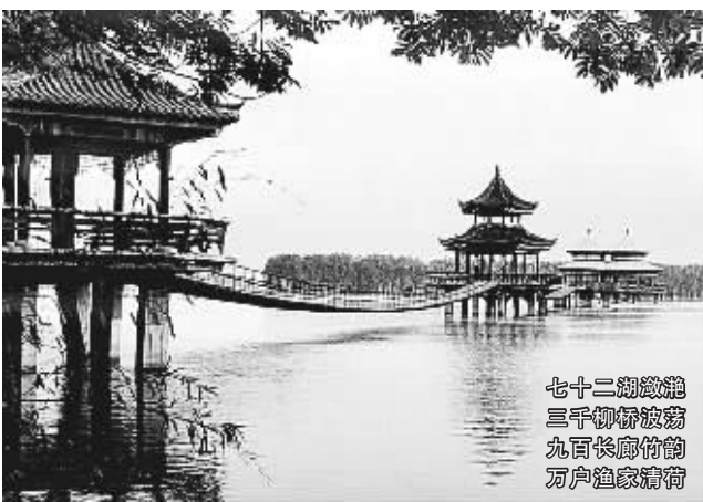
七十二湖徽韵 三千柳絮波韵 九百长廊竹韵 河卢渔家醉韵

本报讯(记者 黄晓娟)盛夏来临,为方便市民出游,本报与中华风旅游·郑州执行机构联合推出一批具有浓郁水乡风情的夏季旅游胜地,并在淮河水乡风情的代表——安徽颖上策划的“暑假欢乐胜地 学子凭证免费”等活动,带你畅游颖上四大景区——八里河、迪沟、小张庄、尤家花园等。观赏水色秀美、幽静静谧的美丽景色;细看淮河水乡最美最大的水上园区——八里河景区;淮河流域