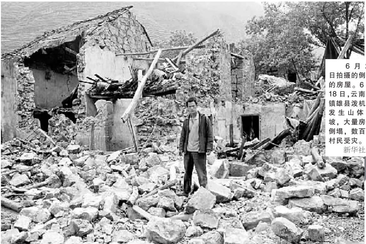
6月20日拍摄的倒塌的房屋。6月18日,云南省镇雄县泼机镇发生山体滑坡,大量房屋倒塌,数百户村民受灾。

这位负责人表示,教育部将会同有关部门加强对全国高校和其他高等教育机构招生管理工作的督查,对超计划招生问题突出、体制外招生和乱收费问题严重、出现严重不稳定事件的地方,将在研究生和普通高校招生计划安排、博硕士学位授权单位和授权点审批、中央专项资金安排以及其他国家教育项目评审、评优等方面予以必要的限制和调控。