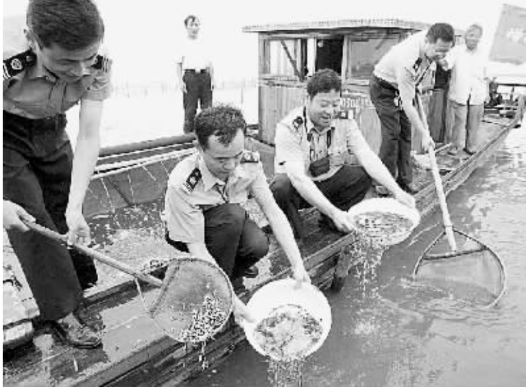
6月20日,苏州市渔业部门在八处太湖水域主要河道同时展开大规模渔业资源增殖放流活动。其中,渔政人员共放流食用浮游生物的白鲢、花鲢等鱼苗160多万尾,以控制该地区的太湖蓝藻。