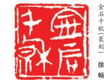
金石千秋篆刻(徐畅)

前些天,我就在经常路过的一个露天啤酒酒店,忽略了一处重要的景点。这个叫做 Bier Garten 的啤酒酒店在我住处不远的街口,走过去也就是十几米的样子。这里经常聚集着很多游客,不仅有德国人,还有很多来自世界各地的人。他们在这里喝酒,吃特色烤肠。还有很多人来这里照相,特别是一些年轻人,他们会在这里拍好多照片。有时候,这一批游人刚走,导游就带着另一些人来了。我并不知道他们为什么对这个啤酒酒店情有独钟,我只是想,也许这里酿