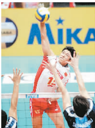
6月24日,在世界男排联赛成都赛区的比赛中,中国队以3:2击败阿根廷队,取得两连胜。

6月24日下午,陈祖德九段、古力九段、谢赫六段,以及刘小光九段、张文东九段、华学明七段等众多围棋高手在北京西单图书大厦与众多围棋爱好者交流,并签名售书。春兰杯世界职业围棋锦标赛是目前唯一由中国内地企业出资举办的世界性围棋赛事,中国棋手在前五届比赛中均未能夺冠。