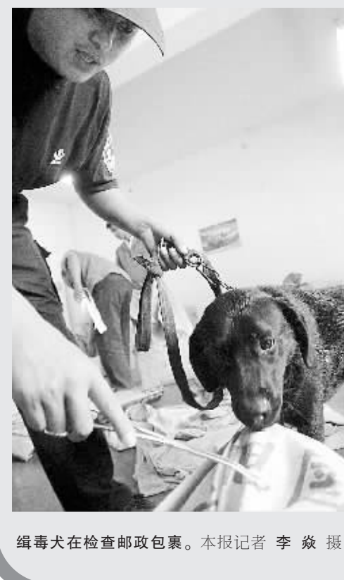
缉毒犬在检查邮政包裹。

据河南省公安厅警犬基地主任孟金贵介绍,“无情”和“吉利”分别属于拉布拉多、史宾格两个品种,它们最早是英国猎犬的一种,经过驯服,用于搜索科目的训练,主要用于搜索毒品和爆炸物。