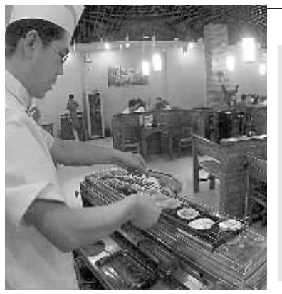
拎起一把羊肉串放在煤气炉上,香气悠然而至,让人欲罢不能。昨日,记者在郑州街头看到了一家极具特色的室内无烟烧烤店。对于崇尚优雅生活的人来说,室内烧烤是个不错的选择。

出体外,容易形成结石或引发痛风。“近一个月来,前来求诊的痛风病人增加了两到三成,患者以身体强壮的中年男性为主,现在的患者越来越年轻了。”如果真想吃海鲜啤酒怎么办?专家建议,可以先将海鲜水煮一下,去掉嘌呤和苷酸,大量饮用开水,及时将尿酸排出体外。吃海鲜的同时,吃些富含维生素A、C、E的蔬菜、水果,但不要吃菜花、菠菜、蘑菇。