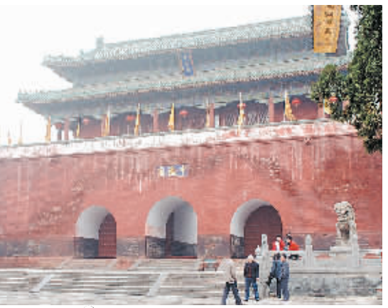
关注申遗 嵩山古建筑群文化之旅 11

皇家气派、官式建筑、道家圣地的“第六小洞天”洞府中岳庙既是祭祀岳神的场所,又是重要的道教宫观。道家尊中岳庙为“第六小洞天”,是因他们认为这里是周朝的神仙王子晋的升仙之处。王子晋又名王子乔,传说是周灵王的太子,他喜欢吹笙作凤凰鸣声,游于伊水和洛水之间,后乘白鹤离去。于是后人在缙氏山和嵩山的顶上建立神祠纪念他。嵩山峻极峰以东的白鹤观,即为纪念王子晋而建。