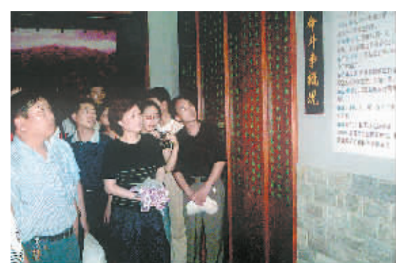
为纪念建党86周年,昨日,市直机关工委组织市直机关百名优秀党员到新县、竹沟革命老区开展“重温入党誓词,再创一流佳绩”活动。

本报讯(记者 王一博)即日起,火车站地区将开展为期两个月的综合整治。昨日,火车站地区召开动员大会,火车站、汽车站、宾馆饭店等服务行业将全面开展诚信经营、文明服务自查自纠活动。