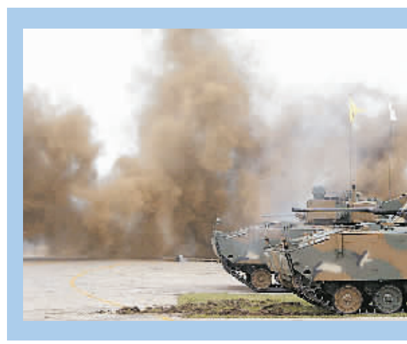
昨日,韩国国防部在忠清南道泰安市首次展出韩国开发的新型K21型步兵战车。