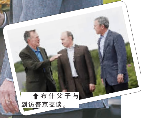
↑布什父子与到访普京交谈。