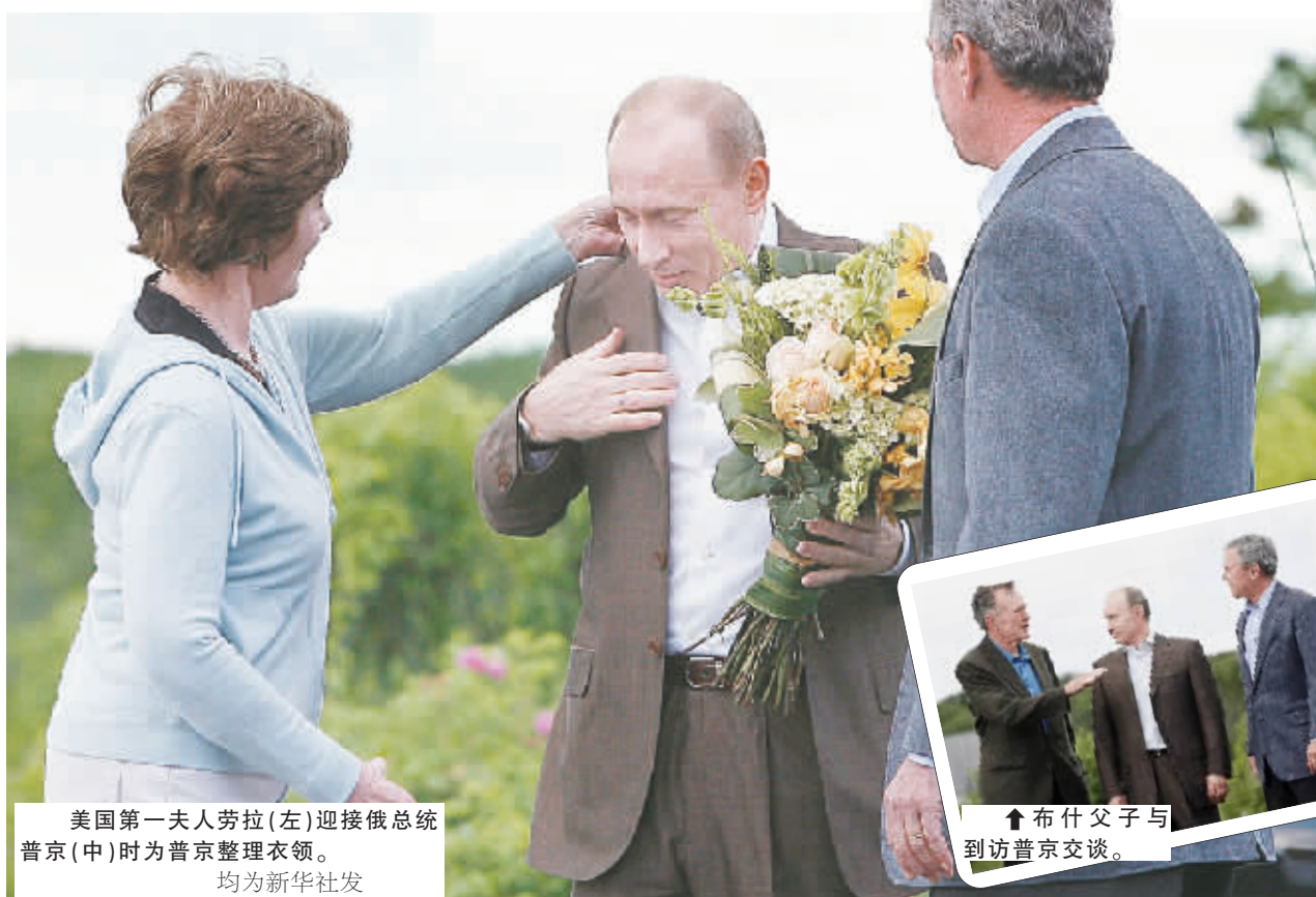
美国第一夫人劳拉(左)迎接俄总统普京(中)时为普京整理衣领。

7月1日，美国驻塞浦路斯大使馆在其官方网站上发表“重要公告”，证实使馆武官托马斯·穆尼已经与使馆失去联络超过48小时。2日，大使馆证实，该武官已经死亡。图为美国大使馆网站首页上登载的失踪武官便装照和一同失踪的轿车。