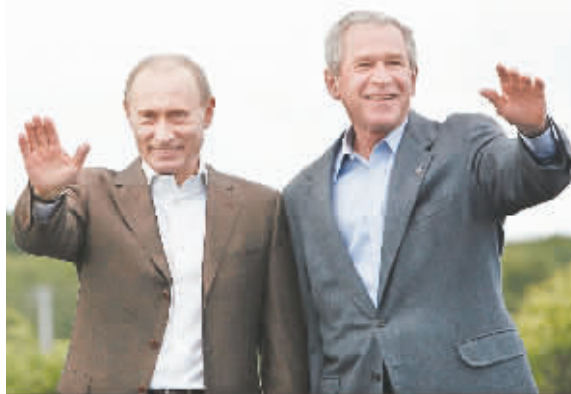
↑美总统布什与到访的俄总统普京一起挥手致意。