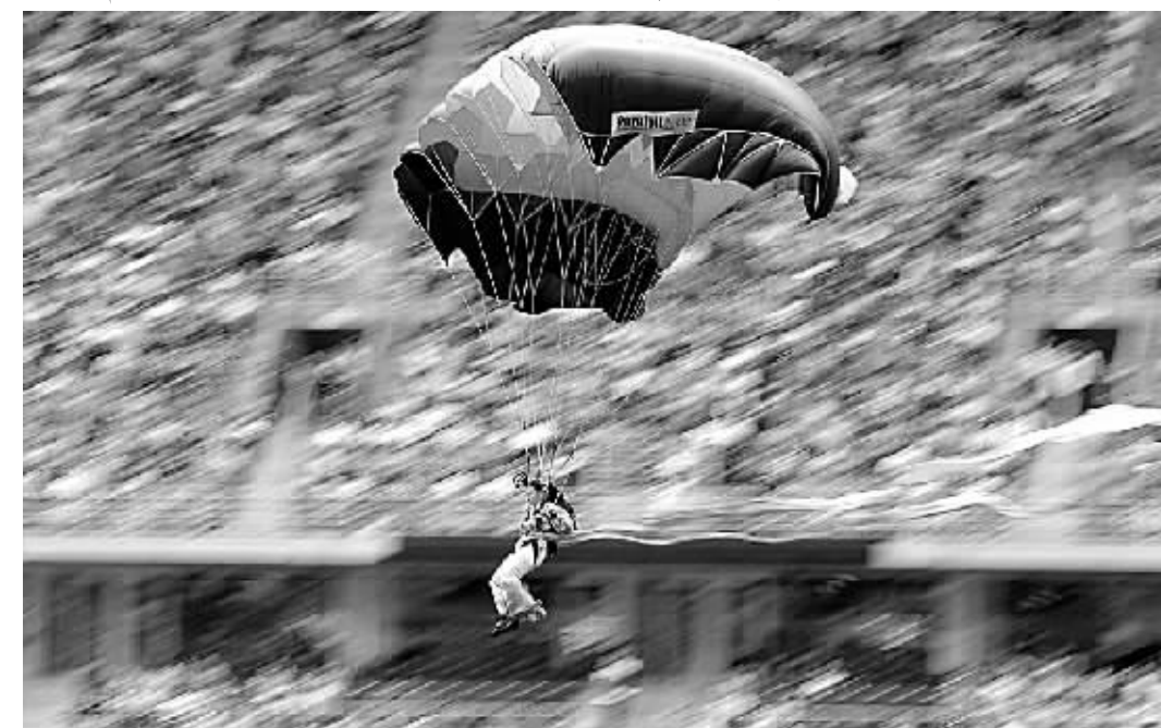
7月2日，解放军八一跳伞队员在表演。当日，“雄鹰翱翔庆回归”——解放军八一跳伞队表演在香港大球场举行。