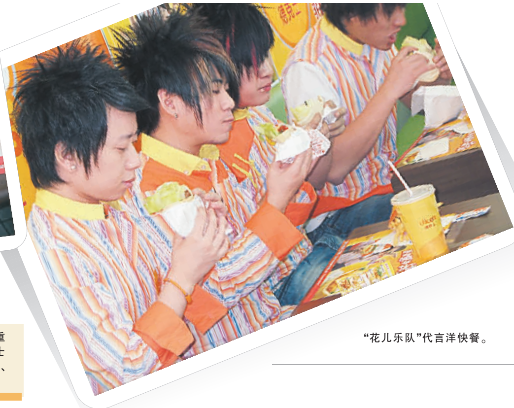
“花儿乐队”代言洋快餐。

西式快餐刚进入市场时,被人们看成“香饽饽”。随着人们更注重健康饮食,摒弃油炸食品,西式快餐也面临挑战。昨日,记者在德克士等西式快餐店采访时发现,西式快餐店“入乡随俗”,也卖起传统的蒸、煮、烧食品,五谷杂粮美味飘香更诱人。