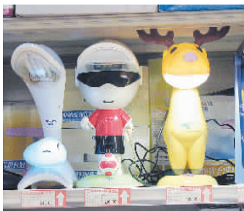
可爱的卡通造型,靓丽的颜色,新颖独特的功能……暑假来临,各种护眼台灯的主流品牌打着“健康、绿色照明、节能”的旗号,纷纷推出设计前卫的卡通造型系列护眼台灯,吸引了不少学生及家长选购。