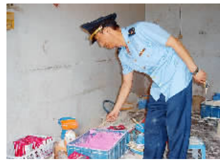
昨日,郑州市工商局专业分局第一检查所工商人员接到群众举报,迅速出击,一举捣毁一生产假冒农药黑窝点,查扣假冒农药水稻纹枯病120桶、清纹曲122桶,水稻粒粒饱、一炮红、蚜虫一次净等农药包装袋5万余只,包装机、封口机等制假工具3台。