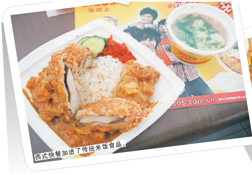
西式快餐加进了传统米饭食品。