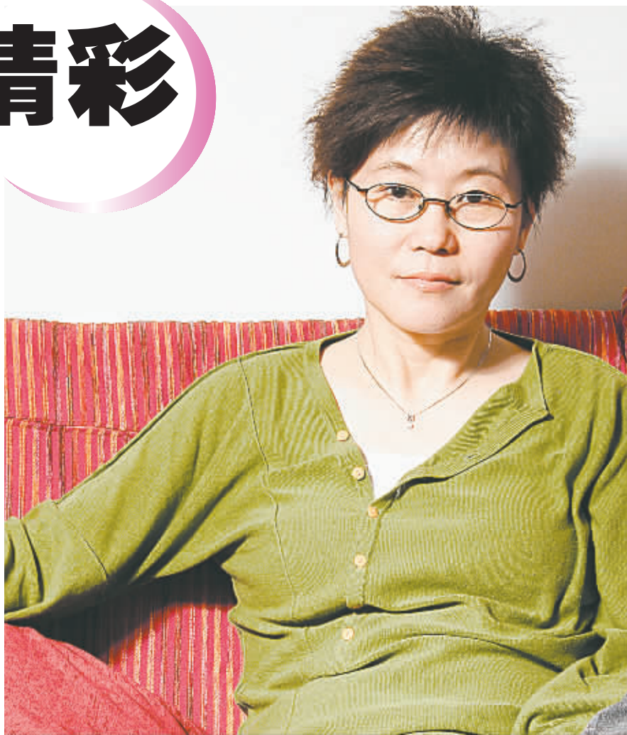
李少红,一个比较追求完美的人。

“我喜欢给自己的人生上紧发条,不愿出现停摆,累些苦些无所谓,只要能给观众带来好的作品,生活在变,我的作品的风格也会跟着改变。”李少红说,她是那种比较追求完美的人,不仅表现在拍戏中,在生活中也要让自己尽量活得精致、富有激情,“而只有拍戏才能让我更精彩。”