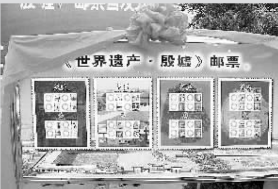
为纪念安阳殷墟“申遗”1周年,昨日,河南省邮政公司特别发行了《世界遗产——殷墟》(第二组)个性化邮票。当日,国家文物局、省文物局向安阳殷墟颁发了“殷墟世界遗产证书”并正式挂牌。

本报讯 据《东方早报》报道,国家质检总局12日发布公告表示:牙膏生产企业不得使用二甘醇作为原料。 昨日,国家质检总局有关负责人表示,根据论证,长期使用二甘醇含量低于15.6%的牙膏不会对人体健康产生不良影响,因此质检总局未建议在含二甘醇牙膏下架,消费者也可以放心使用。 中国牙膏工业协会相关负责人表示,早期国内生产牙膏企业使用甘油作为牙膏中的保湿剂,后来由于国内甘油供应不足,进口价格较高,国内企业开始用二甘醇和甘油的混合体作为牙膏的保湿剂。二甘醇使用将近20年来,从未发现过问题。近年来,随着二甘醇的价格不断攀升,每吨已达11000~12000元,比其他保湿剂贵1倍左右。因此,大部分企业放弃使用二甘醇,转而使用甘油和山梨醇作为替代品。 (李然)