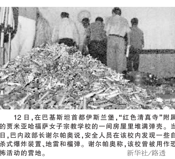
12日,在巴基斯坦首都伊斯兰堡,“红色清真寺”附属的贾米亚哈福萨女子宗教学校的一间房屋里堆满弹壳。当日,巴内政部长谢尔帕奥说,安全人员在该校内发现一些自杀式爆炸装置、地雷和榴弹。谢尔帕奥称,该校曾被用作恐怖活动的营地。