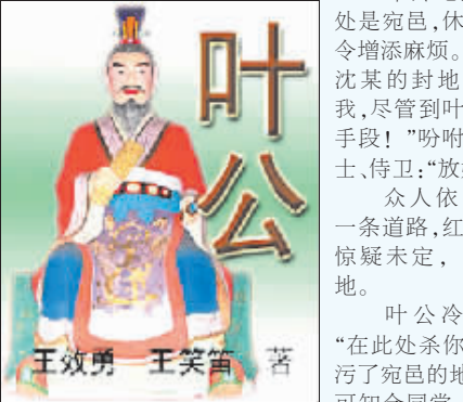
王效勇 王笑箫 著

红衣舞女狠毒凶狠,冷笑道:“今日刺你不死,来日须没有这般侥幸!方城之外,正是你的葬身之地!”