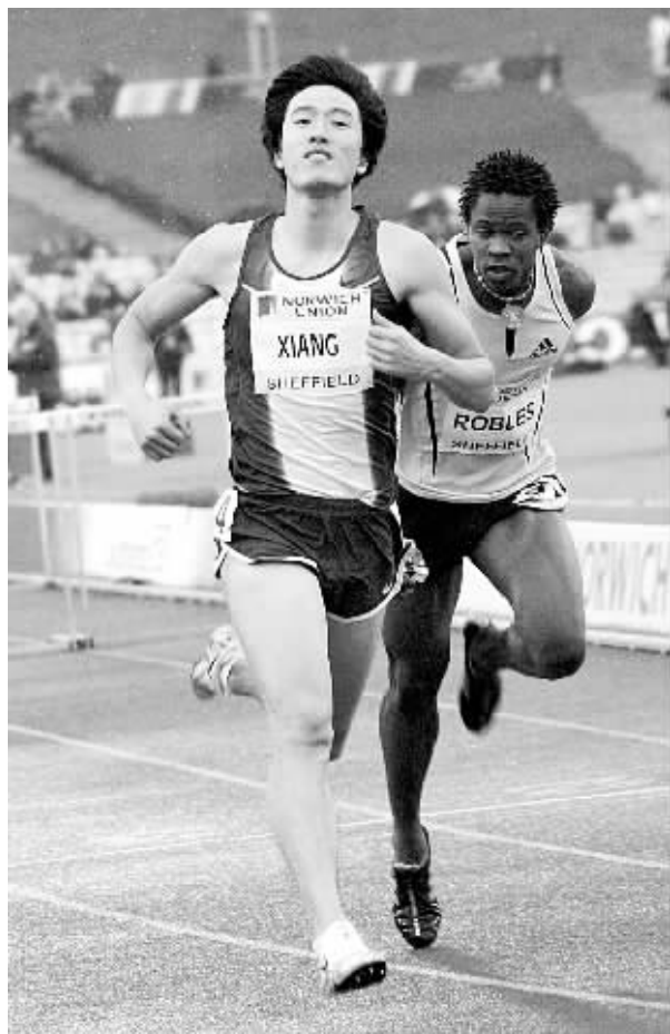
7月15日,中国选手刘翔(左)在比赛中冲刺。当日,刘翔在英国谢菲尔德举行的英国田径大奖赛男子110米栏比赛中以13秒23的成绩夺冠。

在第二场比赛中,比利时临阵换将,以年仅14岁的塔·亨德勒替下了14日败在孙甜甜拍下的费斯,迎战中国队的双打高手晏紫。晏紫以7:6(3)抢下第一盘,先声夺人,但在第二盘中,她的第一个和最后一个发球局却被对方破掉,以2:6输给对手。在第三盘较量中,晏紫接连破掉了对方的两个发球局,取得了3:0的领先优势,但此后,晏紫又接连被对方破发,双方在前八局战成4平。此后,晏紫在关键的第十三局破发成功,最终以8:6赢下了比赛,并帮助中国队在大部分上取得了3:1的胜局。