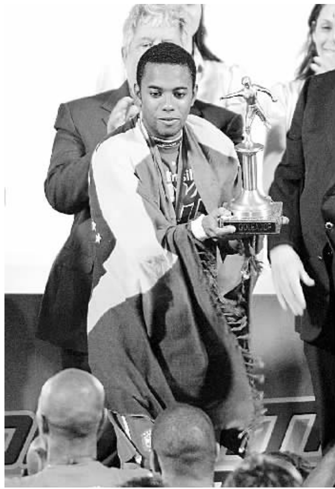
上图:巴西队队员罗比尼奥获得本届杯赛最佳射手奖。 右上图:巴西队庆祝胜利。