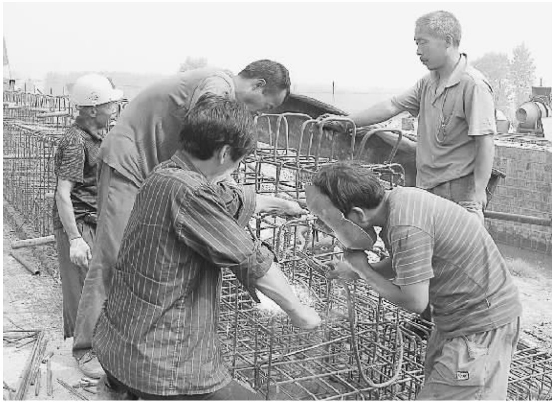
总投资 5600 多万元的 S323 线公路改建工程正在紧张施工,截至目前,总工程量已完成 50%。沿线 15 处涵洞和背阴坡桥作为该线路上的艰巨工程,也已完成工程量的 90%。待涵洞和桥梁架设计划结束后,工程进度将逐步加快,预计 10 月 1 日前即可竣工通车。图为正在施工的背阴坡桥。

了全面排查。此次排查的重点包括全市范围内砖瓦窑场、石灰石料场等农民工相对集中单位和职业介绍机构。在排查过程中执法检查人员主要针对农民工来源是否通过正规中介机构介绍,是否有坑蒙拐骗现象;砖瓦窑场是否有限制人身自由,强迫劳动,打骂虐待现象;是否依法签订了劳动合同,劳动合同内容是否农民工真实意思表示;是否有拖欠农民工工资和非法使用童工现象等。