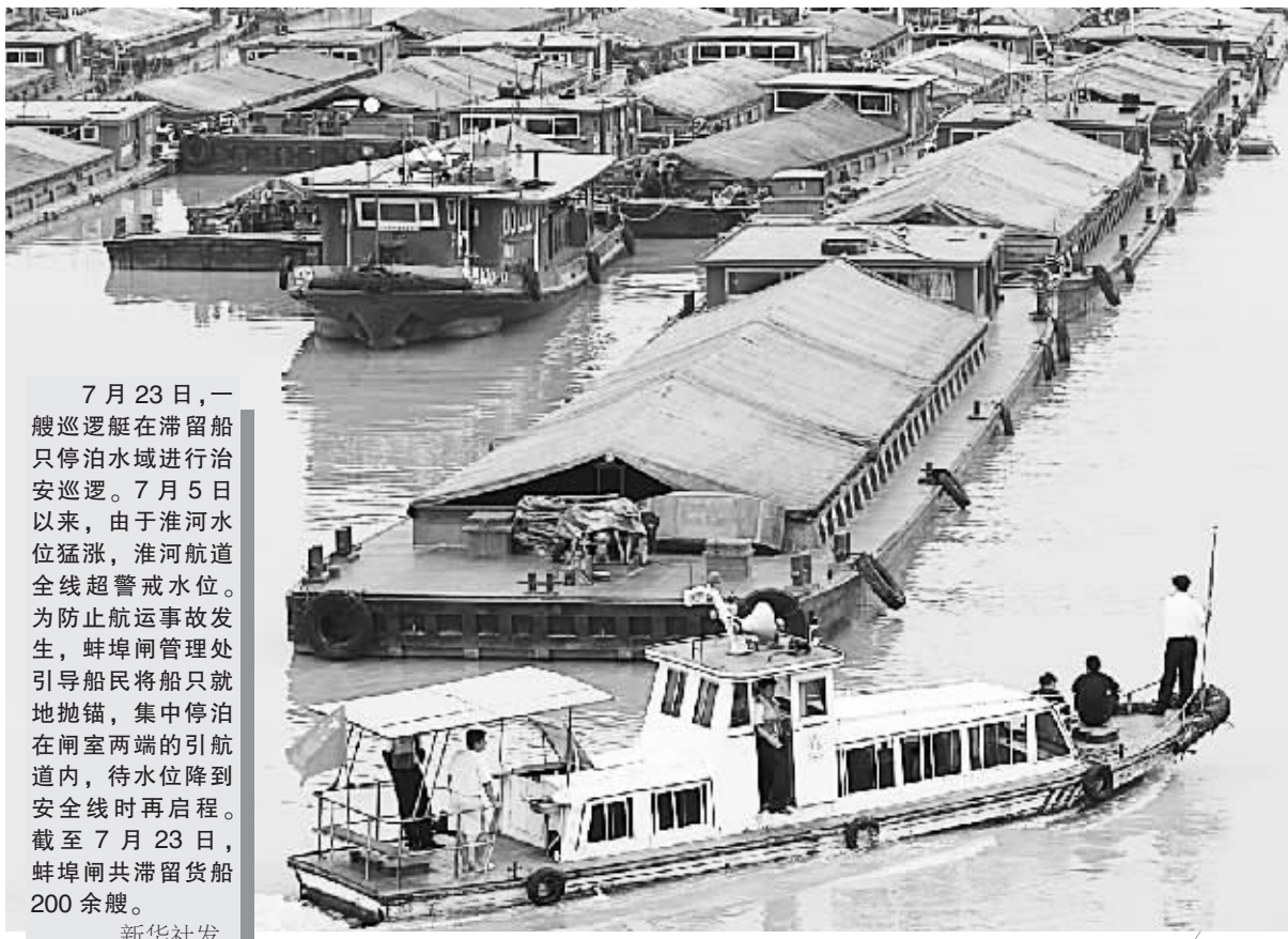
7月23日,一艘巡逻艇在滞留船只停泊水域进行治安巡逻。7月5日以来,由于淮河水位猛涨,淮河航道全线超警戒水位。为防止航运事故发生,蚌埠闸管理处引导船民将船只就地抛锚,集中停泊在闸室两端的引航道内,待水位降到安全线时再启程。截至7月23日,蚌埠闸共滞留货船200余艘。

事故发生后,兰州铁路局领导迅速赶赴现场,组织人员全力抢险,部分旅客列车因事故造成晚点。