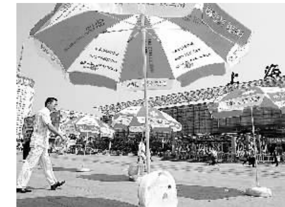
7月24日,尽管骄阳似火,但上海火车站外新建的遮阳棚下空无一人。据旅客反映,他们不愿在遮阳棚下候车,一是因为烈日下的遮阳棚温度高达40℃,并不凉快;二是棚内无座椅,在棚内候车“活受罪”,还不如找个阴凉处更舒适。 新华社发

21日上午,榆林城区部分群众突然发现自来水管道流出的水变成了黑褐色。9时,榆林市自来水公司发现自来水变黑现象覆盖了大部分城区。经过紧急调查,自来水变黑的原因是