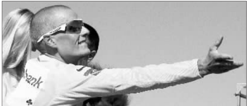
身穿黄色领骑衫的拉斯姆森在第16赛段领奖台上。