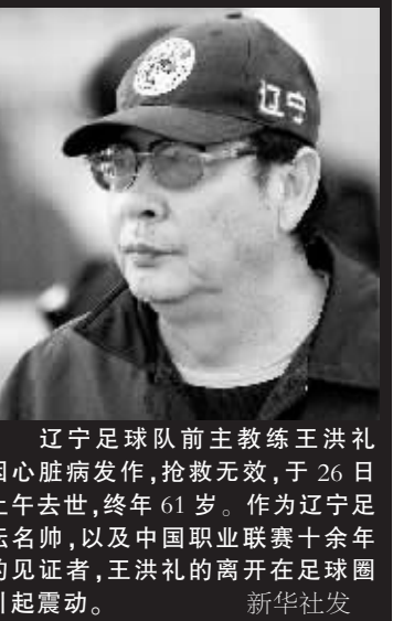
辽宁足球队前主教练王洪礼因心脏病发作,抢救无效,于26日上午去世,终年61岁。作为辽宁足坛名帅,以及中国职业联赛十余年的见证者,王洪礼的离开在足坛引起震动。