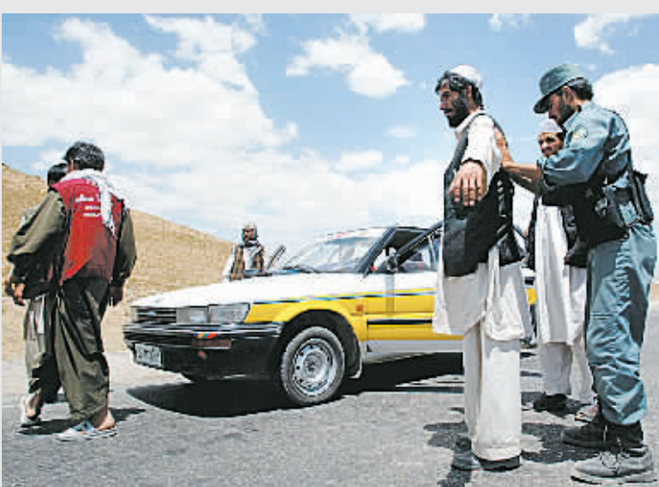
上图:韩国人质家属忧心忡忡。