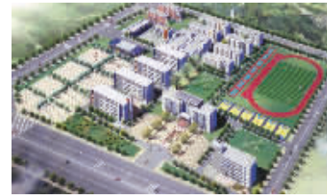
郑州交通技师学院现代化的新校区鸟瞰图