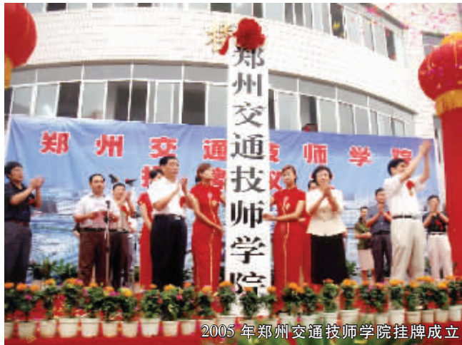
2005 年郑州交通技师学院挂牌成立