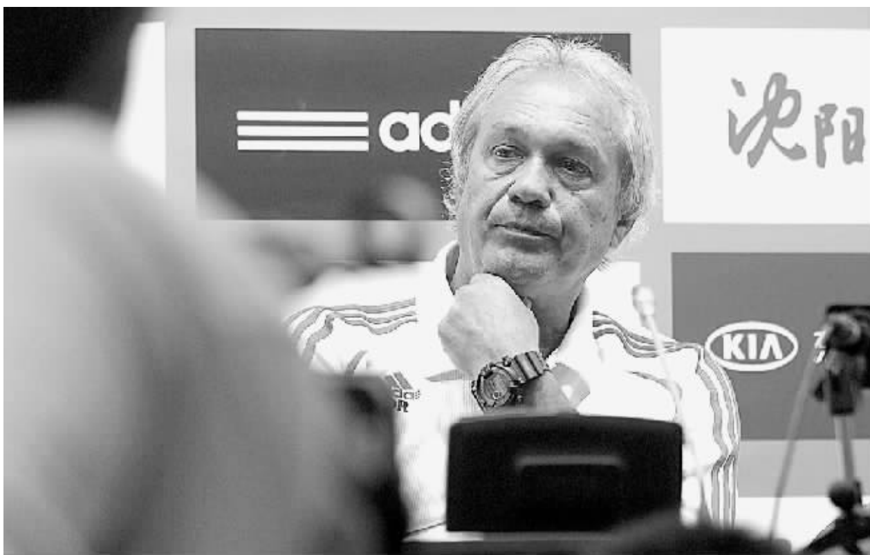
7月31日,中国国奥队主教练杜伊科维奇在沈阳奥体中心出席新闻发布会。当日,国奥四国足球锦标赛举行正式新闻发布会,中国国奥队、日本国奥队和朝鲜国奥队的主帅都出席了新闻发布会,由于航班原因7月31日中午才能到达沈阳的博茨瓦纳国奥队主教练未能出席。本次比赛将于8月1日晚在沈阳奥体中心五里河体育场举行。