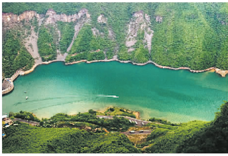
云台山子房湖

表的一生清誉受到玷污,为人话柄。由于他的教授身份,也令士林蒙羞,高挂汗颜。究其原因,决不是一句“空巢老人”问题所能解释的。当然,林老先生是该去看看心理医生了。可是那些看客,不,那些过分热心、促成其事的帮忙帮闲们,在一只死狗身上做成了大买卖,数钱数得手发酸;策划者、捞钱者,该如何反躬自省,自刎自律?该不该对自己的灵魂来一番净化和救赎?