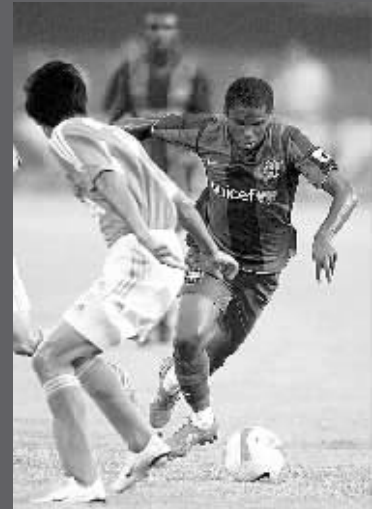
巴塞罗那队球员埃托奥(右)带球突破。

8月5日,西班牙巴塞罗那队球员罗纳尔迪尼奥(右一)在比赛中与北京国安队球员争顶。当日,在北京丰台体育场举行的友谊赛中,巴塞罗那队以3:0战胜北京国安队。