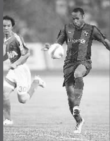
巴塞罗那队球员亨利(右)在比赛中控球。