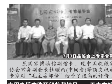
7月3日品鉴会上专家合影

四、首部“国家立传式”领袖藏品，“第一”、“划时代”就是价值保证。在收藏界，“第一原则”是最重要的。中国第一枚邮票大龙邮票，现在成为邮票之王；第一套生肖邮票(80年黄玉庚申猴票)整版发行面值仅6.4元，现已涨至近26万多元。可见“第一”的价值有多大。作为国家首部“国家立传式”领袖藏品，建国58年来的首部“毛主席邮传”，将来不要贵到什么程度。