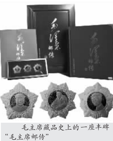
毛主席藏品史上的一座丰碑“毛主席邮传”

老邮票是“纸黄金”，历史上的毛主席珍品，全面浓缩了毛主席时代的烙印和他的伟大思想，是毛主席的宝贵财富。首部“毛主席邮传”，第一次把存世的毛主席珍品进行全面的梳理和总结，因其时间跨度长、藏品珍贵、存世稀少，协作部门倾力力量，多年前就开始向全球收集毛主席珍品，最后由毛主席珍品专家、党史研究专家以及邮票专家组成的专家组，精挑细选出最能准确反映毛主席生平与思想的品种，组成102枚“毛主席珍品原票大全套”。