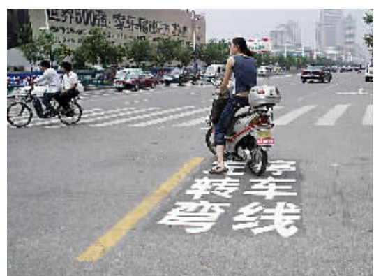
机动车行驶至人行横道线时遇有行人横穿应主动停车让行,确保安全。

为更好地明确路权,充分体现“以人为本”理念,在路段人行横道前粘贴“停车让人”四字,机