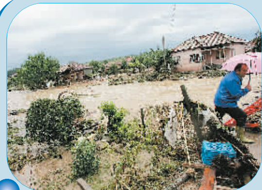
8月7日,一名保加利亚男子走过被洪水破坏的民宅。连日来的降雨使保加利亚部分地区遭遇严重水灾,目前已造成6人死亡,9人失踪。