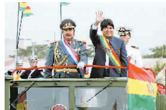
8月7日,玻利维亚举行盛大的国庆阅兵游行,庆祝玻利维亚独立182周年。

此外,洪灾还造成上百栋房屋倒塌,数万户居民房屋和数万公顷农田被淹,多处道路、桥梁和堤坝被毁,部分地区交通中断,中部地区成为一片泽国。