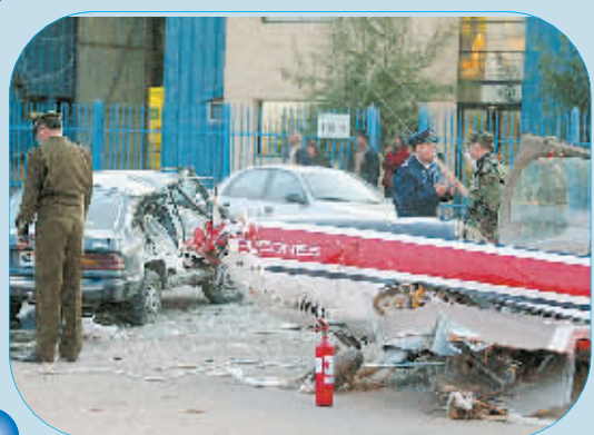
8月7日,智利空军一架参加特技飞行表演的飞机在首都圣地亚哥一条公路上紧急着陆时与三辆汽车相撞,但没有造成人员伤亡。均为新华社发。