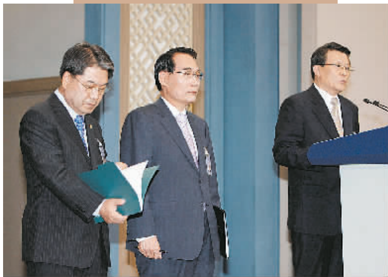
8月8日,在韩国首都首尔的青瓦台总统府,总统府统一外交安保政策室长白钟天(右)宣布韩朝首脑会晤的计划。左为韩国统一部长官李在祯,中为韩国国家情报院院长金万福。