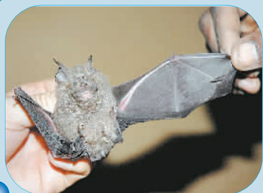
8月7日,野生动物保护协会宣布在非洲的刚果民主共和国发现一种新的蝙蝠。这种蝙蝠生活在长期以来科学家无法进入的战乱地区。