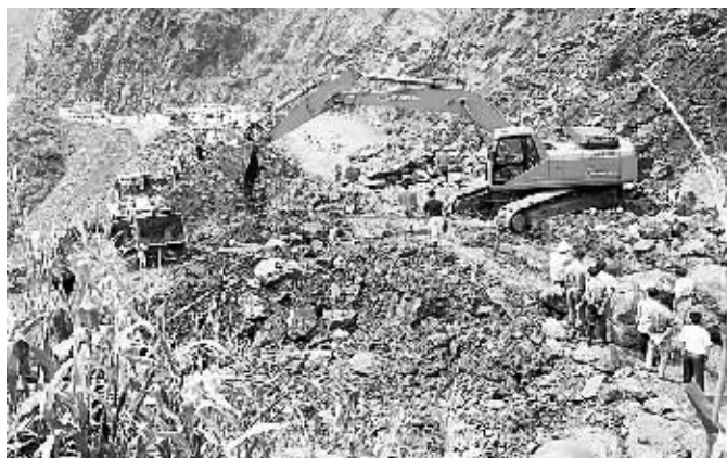
8月7日,施工人员修复被山体滑坡破坏的公路。近日,云南省昭通市出现强降雨,造成昭(通)彝(良)公路洛泽河镇路段发生多处山体滑坡。

述了自己的全部犯罪事实,这些罪行中大部分侦查机关尚不掌握,其行为符合《刑法》和最高人民法院《关于处理自首和立功具体应用法律若干问题的解释》的相关规定,应认定为自首;同时,胡星归案后全部退赔了其犯罪所得的赃款赃物及其孳息,确有悔罪表现,依法可对其从轻处罚。 胡星罪行极其严重,论罪应当判处死刑。但胡星具有自首情节并确有悔罪表现,如实供述了所犯罪行,依法应当从轻处罚。