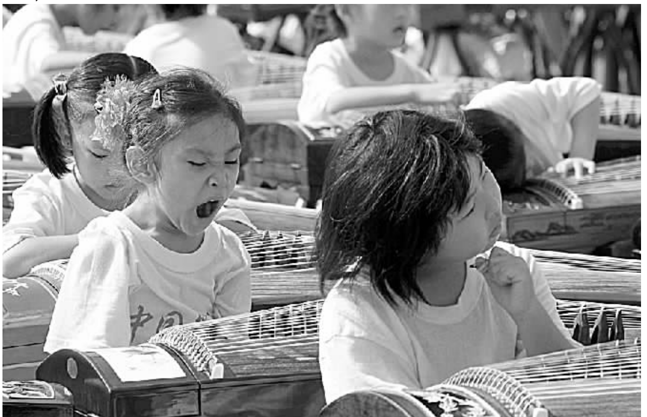
8月8日,在辽宁葫芦岛顶着烈日参加演出的学生疲惫不堪。当日,辽宁葫芦岛举行“创新吉尼斯世界纪录大型古筝演奏会”,以学生为主的两千多名选手在烈日下演出4个小时。热衷于创新吉尼斯世界纪录的行为,让学生受苦。部分家长质疑:这是谁的吉尼斯世界纪录?