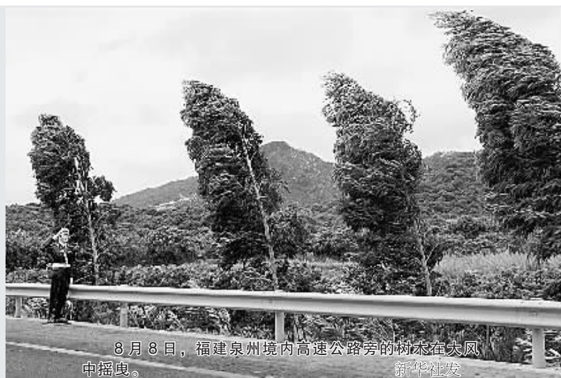
8月8日,福建泉州境内高速公路旁的树木在大风中摇曳。

10日下午影响福建,其威力比“帕布”更强。 另据福建省气象台预报,今年第7号强热带风暴“帕布”正以每小时25公里左右的速度向西北偏西方向移动,可能于8日晚在广东汕头以南登陆。 福建省防汛办截至8日9时30分统计,福建全省50401艘出海渔船已全部进港避风。全省安全转移海上作业人员26.6万人,其中出海船只转移上岸人员24.32万人,海上养殖渔排人员转移上岸2.28万人。