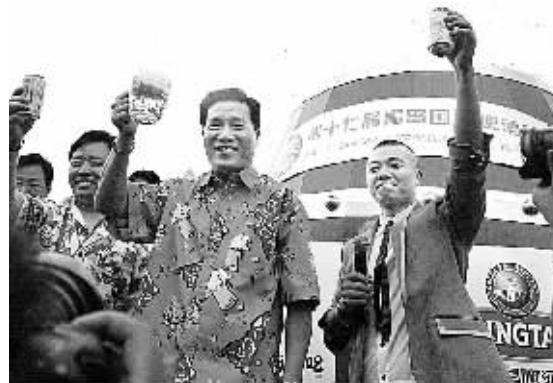
8月11日，在第一桶啤酒开启后人们举杯庆祝。当日，主题为“青岛与世界干杯”的第十七届青岛国际啤酒节开幕。