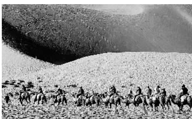
8月11日，一些游客骑着骆驼在甘肃敦煌鸣沙山旅游景区体验沙漠风情。进入暑期以来，敦煌的游客数量明显增加，仅7月份就超过20万人次。

组，杜绝跨地区、跨部门(行业)组团，与项目无关的“搭车”人员一律不得派出。不得超标准申领经费，不得用公款报销开支标准范围以外的一切费用。公费出国(境)培训团组一律不准由旅游部门或旅行社渠道来承办或转包；培训、考察渠道经批准确定后，不得随意变更；不得擅自延长在国(境)外的期限，不得擅自变更培训或考察路线，严禁变相公款出国(境)旅游观光。