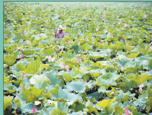
近日,苏州“荷塘月色”湿地公园一期工程即将完工,千亩荷塘中的荷花陆续开放。据介绍,这座公园是由300多个沉箱鱼塘和200多座荒滩废弃河道改建而成的。