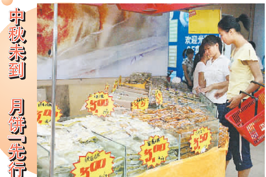
尽管现在离中秋节还有40多天,但记者昨日在几家大型超市和卖场看到,散装月饼已经开始上市销售,一个125克的月饼卖到3至5元,满足了一些市民的需要。

也有一些知名品牌厂家对部分品种提价,提价的品种多集中在简易包装的低端产品,提价幅度10%左右。一些厂家表示,中高档月饼已经没有了提价空间,由于厂家利润空间较大,一般会适当压缩利润。