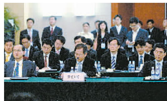
8月16日，六方会谈朝鲜半岛无核化工作组第二次会议在辽宁沈阳正式召开。这是韩国代表团在会议上。