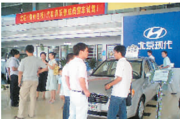
雅绅特 受到参加团购读者的关注。

8月17日上午,北京现代“接力”郑州日报购车俱乐部,北京现代伊兰特、雅绅特尽显“风流”,让郑州日报购车俱乐部的近20位会员青睐有加。本次团购活动不仅让参与的会员选到了合适的爱车,更让他们感受到了河南长江汽车销售有限公司的“冠军”服务品质。