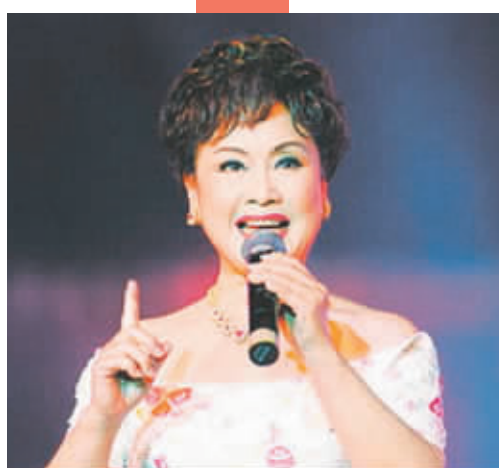
笔笔这次的合作对象是民歌老前辈李谷一

商》在新浪网连载后,引起了读者的强烈关注,看到许多读者在网上留言“希望能早拍电视剧,也让河南文化火一把”“河南的《大宅门》”以及期待看到更多《大瓷商》的内容,外表颇严肃的南飞雁开心地笑了。