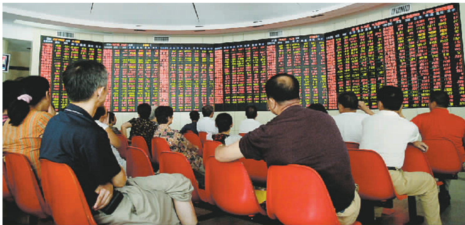
昨日,沪指一举突破五千点,股民们坐在交易大厅里,密切关注大盘走向。

郑州市价格监测中心预计,近期我市猪肉价格将保持高位小幅振荡态势,出现大幅度涨跌的可能性较小。