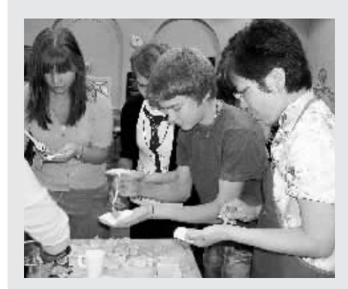
24日,在芬兰首都赫尔辛基雷苏中学的礼堂内,芬兰学生在中国老师的指导下学习包饺子。当天,“中国日”活动在芬兰雷苏中学举行,来自北京大学附属中学的学生展示了茶艺、京剧等中国传统文化。

美国三架现役航天飞机在未来几个月内将继续迎来飞行任务,最近将要发射的是“发现”号,其预计升空时间为10月23日。