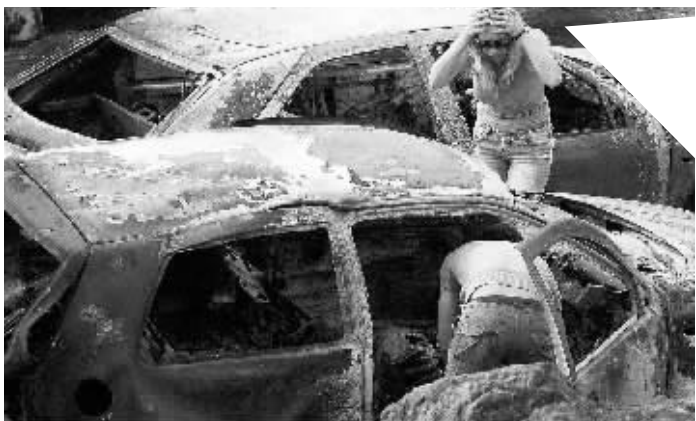
25日,希腊一名妇女看到被森林大火烧毁的汽车惨状后十分惊愕。据希腊媒体报道,希腊森林火灾已造成37人死亡,其中包括3名消防队员。希腊总理卡拉曼利斯当日宣布全国进入紧急状态,他说发生多起火灾“不可能是巧合”,纵火犯将受到惩罚。