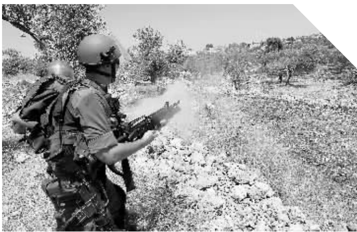
24日,在约旦河西岸边缘与以色列接壤的巴勒斯坦村庄贝勒因,以色列军警向示威者发射催泪瓦斯。当日,来自以色列和一些其他国家的和平爱好者与巴勒斯坦人一起举行支持巴勒斯坦、反对以色列占领的游行示威,3人遭到逮捕。

此前,网络上也有其他软件程序可提供宇宙天体的图像等信息,此次“谷歌天空”实现了所有信息的“无缝链接”,即通过鼠标简单地拖拽、放大图像,可以让人们面对星空想看哪儿就看哪儿。