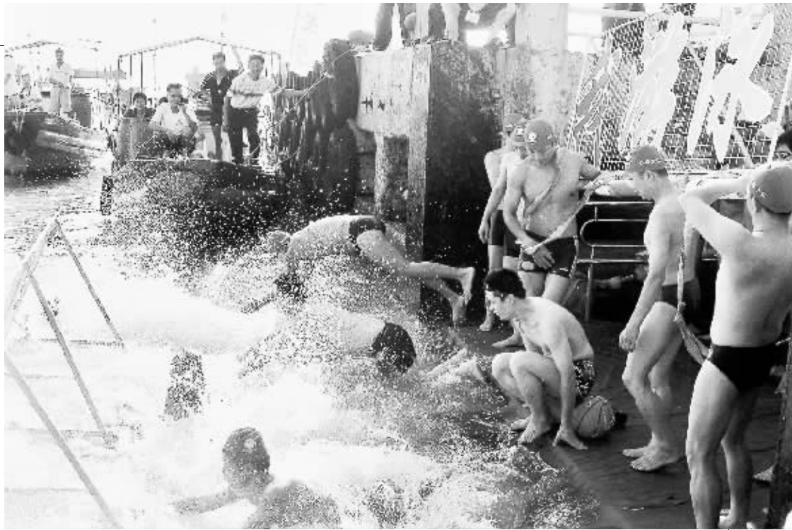
8月25日,游泳爱好者在汕头碧石海湾轮渡码头下水。当日,2007年汕头市“金刚国际渡海节”在广东省汕头市碧石海湾举行,1300多名游泳爱好者横渡直线距离达1200米的海湾,他们中间年龄最小的只有9岁。