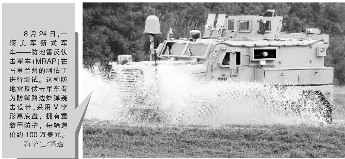
8月24日,一辆美军新式军车——防地雷反伏击军车(MRAP)在马里兰州的阿伯丁进行测试。这种防地雷反伏击军车专为防御路边炸弹袭击设计,采用V字形高底盘,拥有重装甲防护,每辆造价约100万美元。