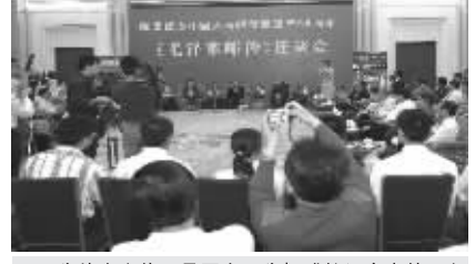
为伟人立传,是国家至为权威的纪念事件,必须由中共中央直属机构中共中央文献研究室推出,而且一位伟人只有一立传机会,这是共和国第一部伟人邮票藏品传记。图为北京举行隆重首发式。