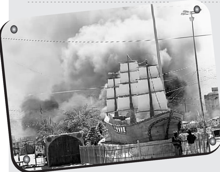
伊拉克什叶派圣城卡尔巴拉28日发生激烈枪战,至少51人死亡,200多人受伤。警方宣布实施宵禁,停止节日庆祝活动,下令大约100万朝觐者撤离卡尔巴拉。