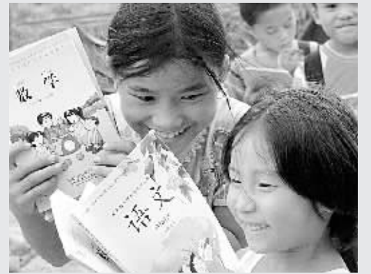
9月2日,湖南省邵阳县下花桥镇中心小学的外来农民工子女领到了免费课本。据悉,从秋季学期起,邵阳县取消外来农民工子女的借读费,外来农民工子女与当地孩子一样,同享“两免一补”的政策。

据了解,高新区现有15所中小学,每天在校用餐人数约1.5万人。前段时间肉价上涨的时候,适逢暑假。开学后,鉴于很多家长和学生对饭菜价格的担心,高新区承诺,将在食堂饭菜不涨价的基础上,提高菜品质量,让学生吃到满意放心的饭菜。具体补贴的方式将按各个学校就餐人数将钱划拨到承包食堂的物管公司。