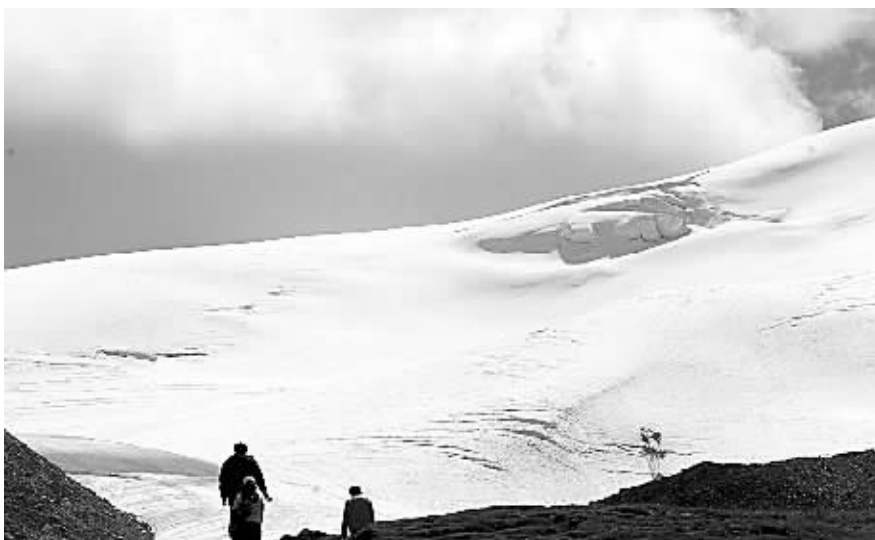
这是位于祁连山中部的“七一”冰川一景。据甘肃省气象局有关专家介绍,气温升高导致祁连山冰川和积雪面积缩减,冰川局部地区的雪线正以年均2米至6.5米的速度上升。专家预计,面积在2平方公里左右的小冰川将在2050年前基本消失,较大的冰川也只有部分可以勉强支持到本世纪50年代以后。