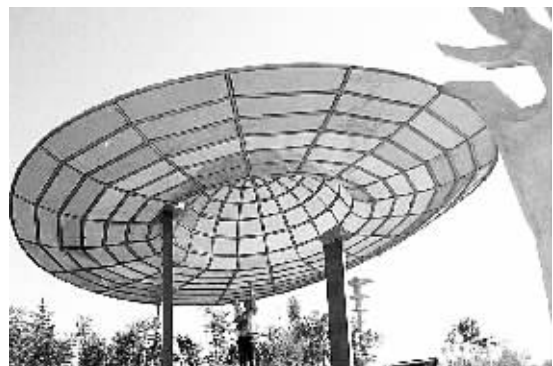
9月2日,一座造型别致的凉亭在黑龙省牡丹江市建成。凉亭外形酷似“草帽”,不时引来过往行人驻足观看。

山西省第十届人民代表大会常务委员会第三十二次会议还决定:接受于幼军因工作变动辞去山西省省长职务的请求。