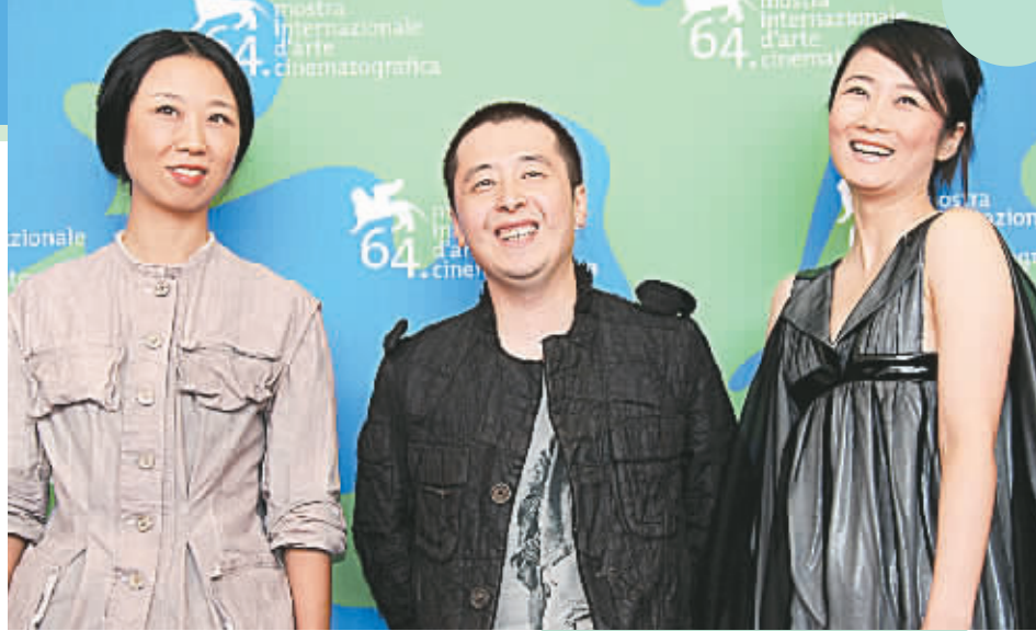
服装设计师马可(左)、导演贾樟柯(中)和监制赵涛出席影片《无用》新闻发布会。

去年,贾樟柯凭借《三峡好人》夺得威尼斯电影节“金狮奖”,而此次《无用》再战水城,贾樟柯表示没有压力很轻松,主要是来享受电影的。他还为这次有多部华语电影来到威尼斯感到高兴。