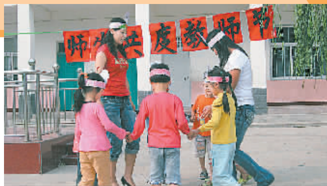
管城回族区站马屯小学师生共演节目。