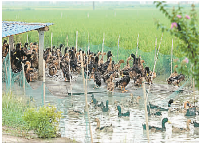
9月4日,在江苏兴化一个“稻鸭共作”基地,一群新鸭在田间地头的“鸭圈”内栖息。“稻鸭共作”是实现稻田可持续种养、节约种养成本的生态农业新技术,在稻田间养鸭吃虫,水稻不打药、不用化肥,生产的无公害稻米品质高。

与鲜猪肉价格下跌不同的是,鲜牛肉、鲜羊肉的批发价格分别上涨0.3%和1.8%。受鸡蛋产蛋率提高影响,鸡蛋价格小幅下跌0.3%。水产品价格下跌0.6%。