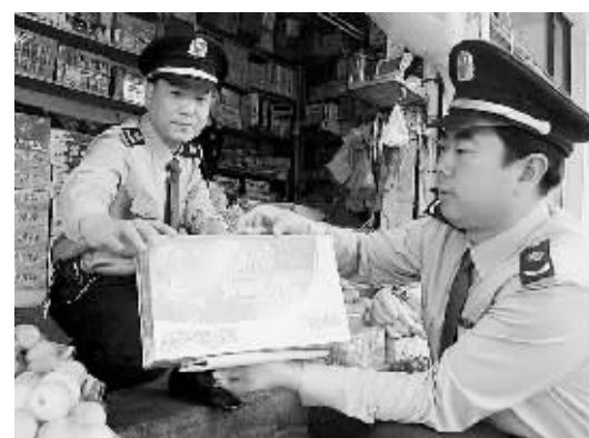
9月5日下午,巩义市工商局市区工商所执法人员在中医院门口三家副食品经销店,依法查处涉嫌假冒“伊利”优酸乳饮料、早餐奶共28箱,并向现场群众讲解了真假饮料、奶的识别办法。

据了解,高纯石墨属于碳素的更新换代产品,主要用于电火花加工、电池板加工及第四代核反应堆等方面,属于高科技尖端产品。该项目作为巩义市院地合作暨经贸洽谈会重点洽谈签约项目,由巩义市市长虹碳素厂与辽宁国瑞商贸有限公司共同合作,成立郑州国虹石墨新材料有限公司,并由郑州国虹石墨新材料有限公司投资建设。项目总投资5000万元,占地52亩,将于年底前建成投产。