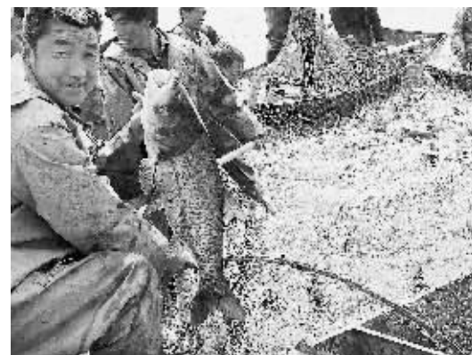
进入9月,登封市白沙水库的鱼儿进入了成熟期,渔民们又迎来了一个丰收年。据悉,白沙水库养殖水面1.3万亩,占登封市养鱼水面的95%。

共享一份爱,同圆一个梦。让我们记住这些让人感动的日子,让我们由衷地感谢所有关注这些孩子的人,是你们的善举让这些孩子看到了希望,让他们、也让我们更加坚信:我们的社会大家庭是如此的和谐温馨!