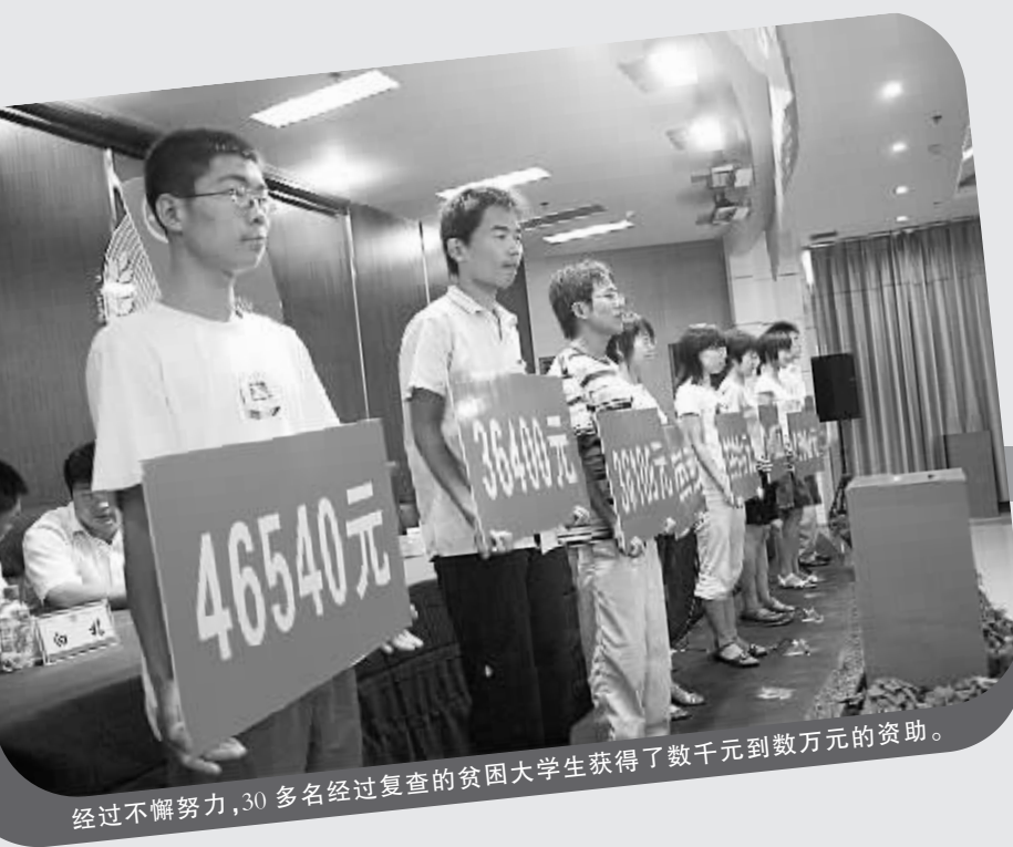
经过不懈努力,30多名经过复查的贫困大学生获得了数千元到数万元的资助。

如此细致入微的工作,赢得了众多热心人士的信任,荥阳籍一位在郑州经商的爱人土得知此项活动后,主动出资资助7名贫困学生全部学费,直至完成学业。又一名张姓老板对6名贫困大学生给予学费全额资助,并每月资助400元的生活费。一名曾经让团市委工作人员坐冷板凳的企业老总在了解了整件事情的进程后,也主动地承担起两名贫困大学生的全部费用。他告诉团荥阳市委书记朱桓雷:“我也非常想献爱心,这些钱交给你们,我非常放心,我知道钱花在了哪里,花在了哪个孩子身上,我心里舒服。”三个多月来,经过不懈努力,共青团荥阳市委收到各界爱心捐款40余万元,有50名贫困大学生和初中升高贫困家庭学生受到“一对一”的资助。