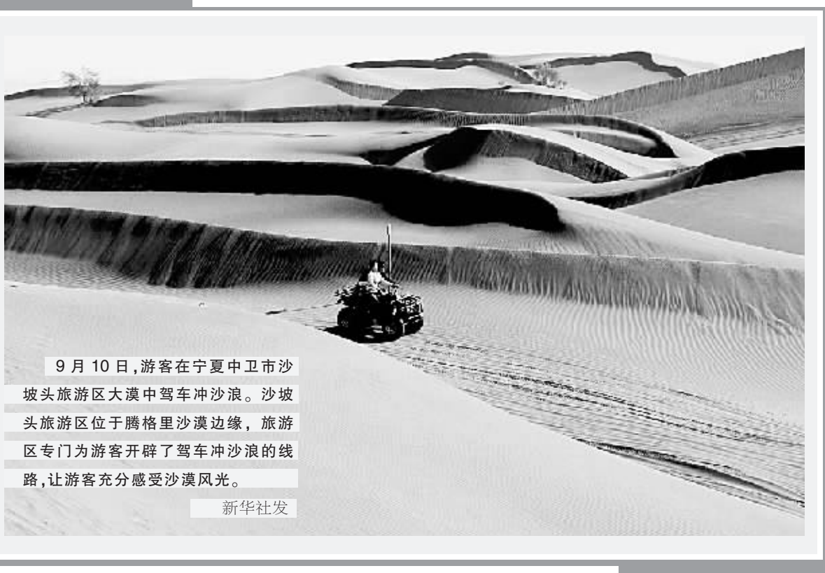
9月10日,游客在宁夏中卫市沙坡头旅游区大漠中驾车冲沙浪。沙坡头旅游区位于腾格里沙漠边缘,旅游区专门为游客开辟了驾车冲沙浪的线路,让游客充分感受沙漠风光。

《规定》要求实施临时出访计划时,要根据任务选择派出人员和境外接待机构,杜绝一般性考察、轮流出访、照顾性出访和搭车出访,并严禁公款旅游等。