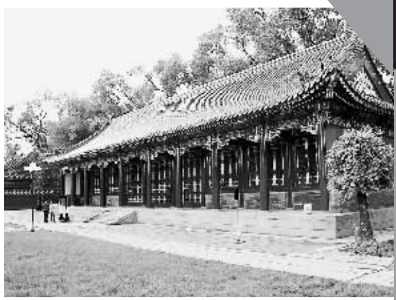
这是修缮一新的哈尔滨文庙西庑。近日,历时近5个月哈尔滨文庙大规模修缮工程完工。据了解,此次修缮是哈尔滨文庙自1929年建成以来的首次大规模修缮,主要修缮对象是文庙的东西庑。