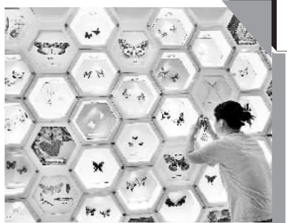
9月9日,一名参观者在昆虫展区拍摄贵州的珍稀蝴蝶标本。近日,贵州大学自然博物馆正式开馆。该馆是贵州省第一所高校自然博物馆,以展示贵州当地自然资源为主。