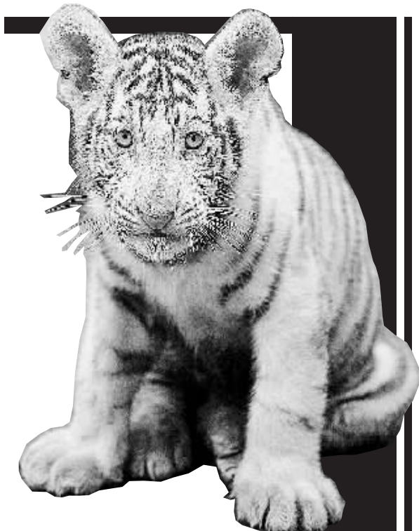
9月10日,天津市动物园首次繁殖的白虎幼仔过百天,吸引了不少市民前来观看。5月31日,天津市动物园饲养的一头3岁孟加拉虎首次繁殖幼仔,成活两只,其中一只为白虎。

年、老人,慢性疾病的康复治疗 and 托管,老年病、中风后遗症、癫痫病、帕金森氏综合症、老年痴呆、以及肢体伤残等需要康复治疗者。 亲爱的朋友如您的亲人需要特别照顾,医院有专业医护人员和专职医生,全院职工树立“爱岗敬业、文明服务、精益求精、视病人如亲人”的服务理念,突出中医优势,让您来者高兴、去者满意,感谢您:您对您亲人的关怀和对社会付出了责任。 电话: 0371-66217716 66217717 地址: 郑州市北下街77号(清真寺对面) 网址: www.dianxianyy.com E-mail: hrt@dianxianyy.com