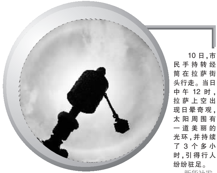
10日,市民手持望远镜在拉萨街头行走。当日中午12时,拉萨上空出现日晕奇观,太阳周围有一道美丽的光环,并持续了3个多小时,引得行人纷纷驻足。

从目前科学考察的结果来看,还没有发现磁极颠倒会给地球带来毁灭性的灾难,因而,消息中所预测的灾难性后果,很多都是非常荒谬的。地球磁场发生颠倒,不会造成重力随之变化,更不会使一些小行星朝地球飞来。