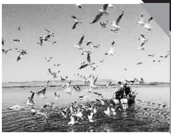
9月7日,一群水鸟在新疆乌伦古湖上空飞舞。地处新疆阿勒泰大草原的福海县乌伦古湖是中国十大淡水湖之一,湖畔人烟稀少,生态环境较好,每年夏季大量水鸟在此栖息,这里也因此成为水鸟的天堂。