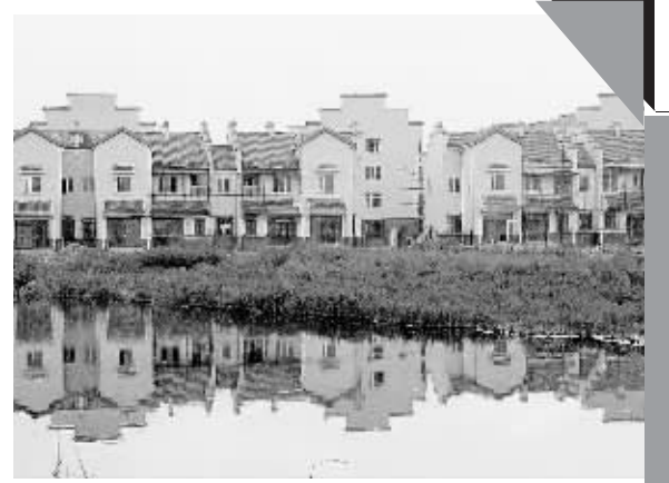
9月9日拍摄的建设中的小站镇微派民居。天津市津南区小站镇居民中有很多是清代准军后裔。作为天津市示范小城镇建设试点,小站镇首期36万平方米的微派民居正在施工中,预计年底竣工。