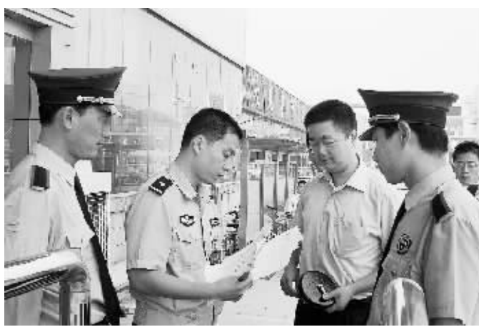
昨日,根据群众举报,郑州市公安局车辆管理所城北服务站对进入办证大厅人员的身份和资料进行严格审核,从根本上杜绝非法中介。