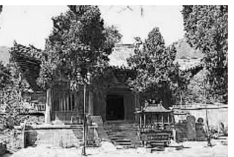
大殿外景