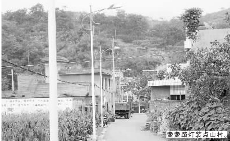
一盏盏路灯装点山村。

称职票,汇总得票情况确定最终评议结果。对评为优秀的干部给予表彰奖励,对称职、基本称职干部继续留任,对不称职干部责令他们向党员、群众代表联席会议作出整改保证,经联席会议通过后方能继续留任或保留待遇。今年7月以来,姚家乡集中时间对20个村的村组干部进行了民主评议。这次集中评议参与党员、群众代表共1283人,评议干部166人,结果被评为优秀的61人,称职92人,基本称职8人,不称职5人。不称职的5名干部,有2人被降职免职,1人被停止干部待遇,2人向党员群众代表联席会议作出限时整改承诺。