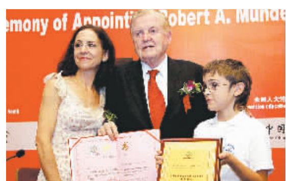
9月12日，“欧元之父”罗伯特·蒙代尔与夫人瓦拉莉·蒙代尔正式受聘“中国青少年艾滋病防治教育工程”首席顾问。

据介绍，这两项业务是中国银联针对市场需求最新推出的银行卡支付产品。通过在家庭、便利店等日常生活及周边场所提供与持卡人密切相关的信用卡还款、缴费、购物等便民服务，缓解银行和缴费网点的柜面压力，免去持卡人排队等候的辛苦。