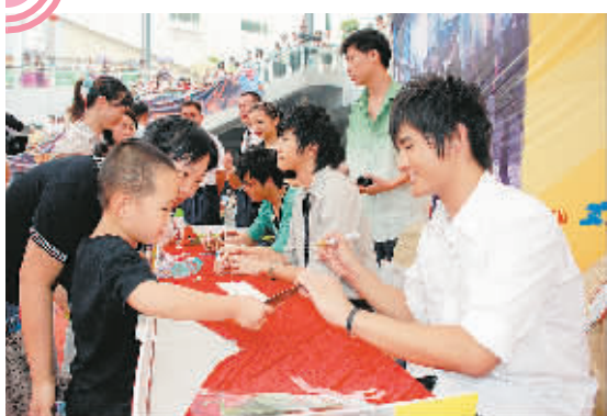
9月16日,一位妈妈带着孩子参加“快乐男声”MP3音乐专辑全球首卖签售会。当日,“快乐男声”MP3音乐专辑全球首卖签售会在深圳举行。

人活着是为了什么?人生的意义是什么?周国平将以开阔的学术视野和博学求精的治学态度,讲述自己对于人生、社会、道德、教育、爱情、婚姻、子女、写作等诸多方面的看法。