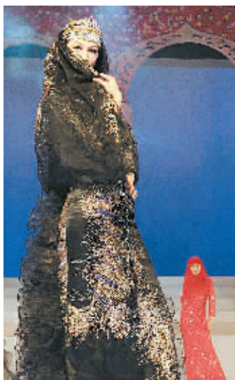
9月16日晚,2007中国宁夏首届回族舞蹈、服饰展演晚会在银川市开幕,200多套时尚、美观的回族职业装、生活装、礼仪装与观众和评委见面。图为模特展示回族晚礼服。