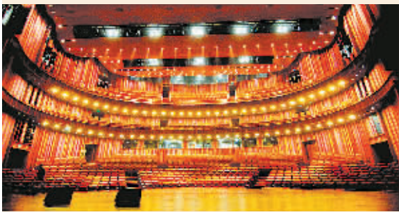
▲戏剧场以上演戏曲、话剧等为主,观众席共有1035个座位。

进,音乐厅拥有全国最大的一台管风琴,共有6500根发音管,音乐厅的观众席是环绕舞台设置的,因此舞台上吊装了一块巨大的龟背反声板用于拢音,在这里演员和乐队都不允许用麦克风,好与不好完全凭实力。戏剧场的配置也非常科学,针对戏剧和戏曲艺术的特点,为了让观众更清楚地看清舞台上的表演,一层观众席只有15排,二层最前排距舞台中心也只有22米。戏剧场的舞台功能极其复杂,15个模块可以完成很多舞台变化,升降的同时还可以旋转,这在世界上也是独一无二的。