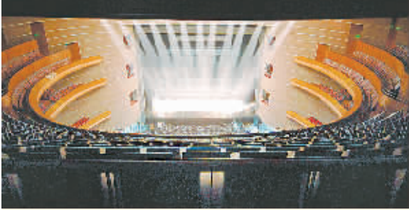
▲歌剧院是国家大剧院内最宏伟的建筑,主要供大型歌剧、舞剧演出使用,座位数2398个。