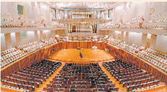
▲音乐厅色调风格宁静、清新而高雅,共有座位2019个,用于演奏大型交响乐和民族乐。