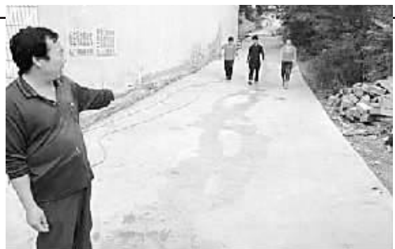
“若不是部队的帮助,我们这辈子也别想走上水泥路高兴地说。解放军测绘学院外实习基地官兵,拿出3万元钱帮该村修路,被当地村民亲切地称为‘军民路’。”

为加强煤炭行业的税收征管,登封市地税局稽查分局深入企业调查核实,随时掌握税源变化动态,争取征管工作的主动权。他们积极与工商、公安、国土、煤管、电管等部门建立起工作联系制度,互通信息,形成控管合力。同时加大专项整顿力度和对煤炭企业税收征管各环节的考核力度,确保税款的及时、足额入库。