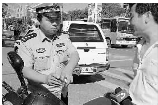
为给“两节一会”创造良好的道路交通环境,近日,登封市公安局交巡警大队在交通秩序整顿期间印制了5万张交通安全卡片,发放给广大市民和驾驶员。

截至目前,登封市行政服务中心已免费为河南省少林寺食品发展有限公司、郑州市海瑞祥商贸有限公司等提供了优质、高效、便捷的代办服务,涉及立项、企业名称核准、卫生许可证、营业执照、建设项目选址意见书、环境影响报告书、代码证、刻章等多项行政审批事项。6个项目投资总额约1.408亿元。