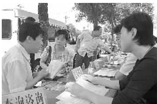
为庆祝河南省《住房公积金管理条例》颁布三周年,9月14日上午,登封市住房公积金管理中心联合市房管局和部分房产开发商在少林路西段开展大型宣传活动。

据了解,全国县域经济基本竞争力评价工作开始于2000年,由成立于1998年的中部县域经济研究(咨询)所组织评选,采用县域经济的综合性、可比性、客观可行性的核心数据进行评价,评比指标包括竞争力、居民收入水平、科学发展环境等。