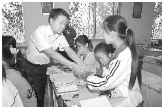
“谢谢！俺一定好好学习、报答社会！”9月13日上午，市希望工程办公室在全市开展“奉献爱心、放飞理想”希望工程助学金发放活动，活动共救助贫困学生156人，发放助学金13.8375万元。