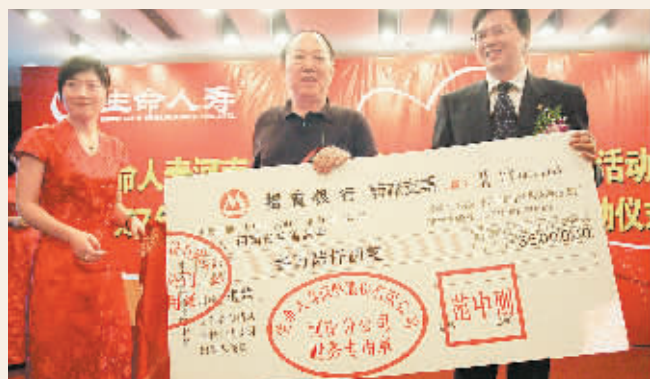
捐出一元钱奉献爱心,生命人寿保险河南分公司8月8日开展爱心“一元捐”活动以来,已筹集来自客户和员工的善款1.6万元。昨日,公司向省慈善总会捐赠3.6万元。