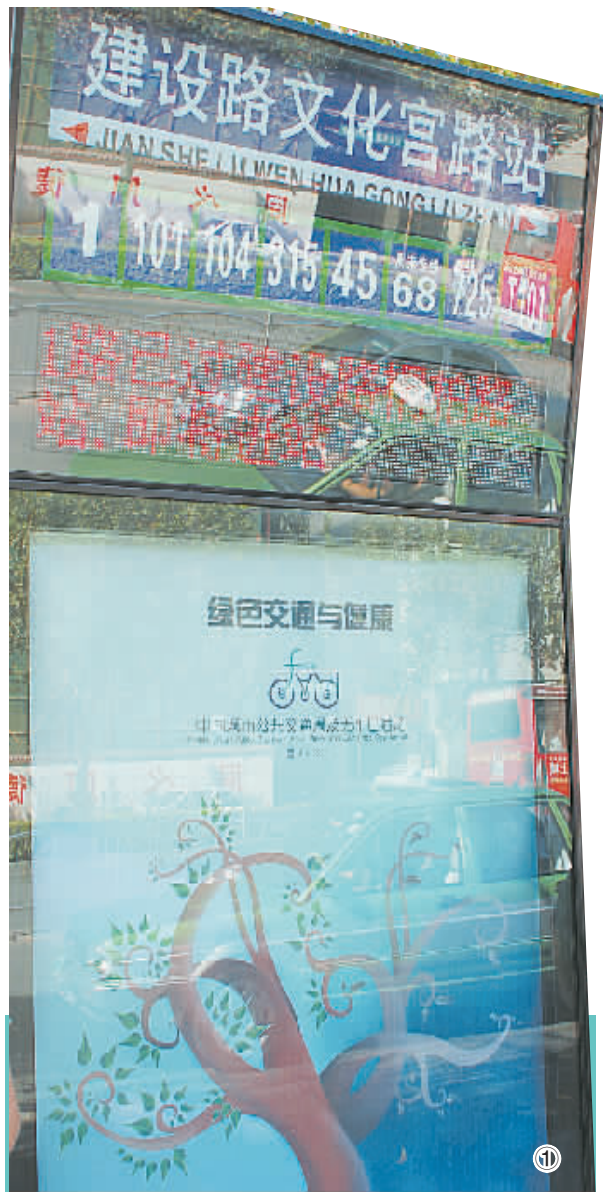
①电子站牌 ②GPS智能调度系统

另据记者获悉,昨日,随着5条新公交线路正式开通,我市公交线路总数突破200条。新开通的5条公交线路分别是:126路、127路、152路、K909路和K963路。