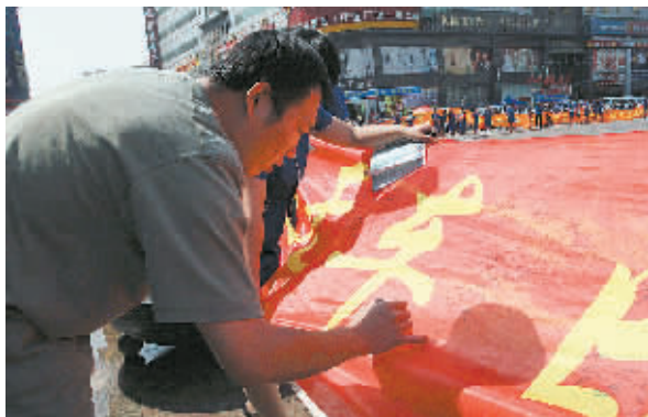
昨日上午10时许,城东路与金水路交叉口,近200名附近单位员工组成的小分队,一起撑起一条长108米的红色条幅向二七广场前进,条幅上醒目地写着“支持无车日万人签名活动”。一个小时后,队伍进入二七广场,现场市民纷纷在条幅上签名。据悉,这条万人签名的条幅将被送到市无车日活动筹委会,支持无车日活动。

104路调度员尹成芳介绍,紫荆山南北道路贯通后,周围涉及的公交站点也进行了调整,不少市民来询问怎样坐车。工作人员详细调查后,制作了4块示意图,悬挂在紫荆山立交桥上,将46条公交线路的站点详细标注出来,方便市民在紫荆山地区乘车。