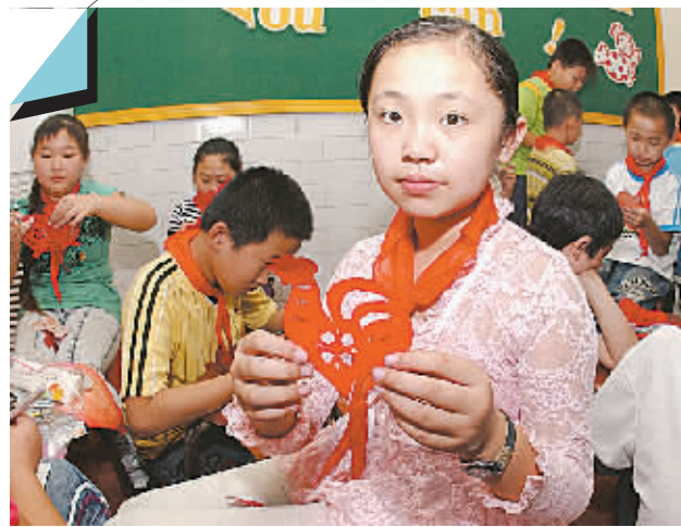
昨日,市盲聋哑学校的孩子们受邀来到二七区实验小学,和这里的孩子们一起庆祝即将到来的中秋节。语言不便,用手势和纸笔沟通,同吃一块月饼,一起制作剪纸,孩子们在快乐中找到了新朋友。